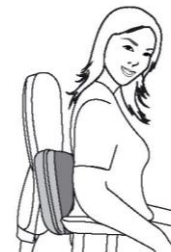
Seljamassaaž: alaselg (selgroo piirkond)